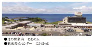
●道の駅象潟 わむの丘 ●観光拠点センター にかほっと